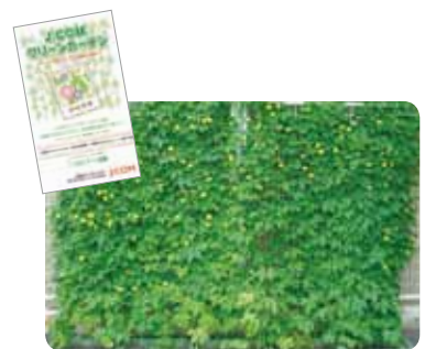
ゴーヤのグリーンカーテン

2011年春には全国で合計75,000袋のゴーヤ・アサガオの種を配布し、節電、省エネの夏に備えて自然の日よけ「グリーンカーテン」の栽培を提案しました。