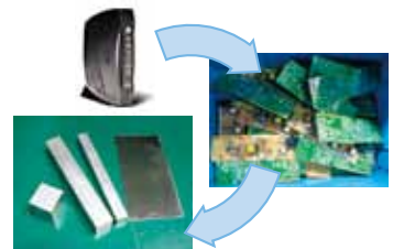
機器を解体し、素材ごとに元の原材料に戻します

お客さま宅でご利用いただくホームターミナルやインターネットモデムは、耐用年数が過ぎるとリサイクル処理がなされます。2010年度は約27万台のホームターミナルと約5万台のインターネットモデムが再生資源に生まれ変わりました。