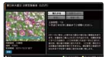
募金 オン デマンドの映像

大規模な災害が発生した際には、J:COMグループは社屋、ジェイコムショップの募金箱、及び募金 オン デマンドで災害支援募金を募っています。2011年3月に発生した東日本大震災の募金も受付しています。* 従業員、お客さまからの募金のほか、復興支援イベントを開催し、その収益の一部を寄付したり、J:COM オン デマンドの視聴数に応じた寄付をするなど、J:COMグループは継続的に被災地の復興を支援してまいります。