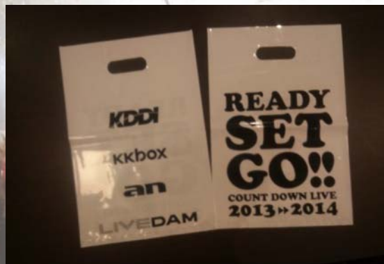
(裏) 企業ロゴが掲載されます